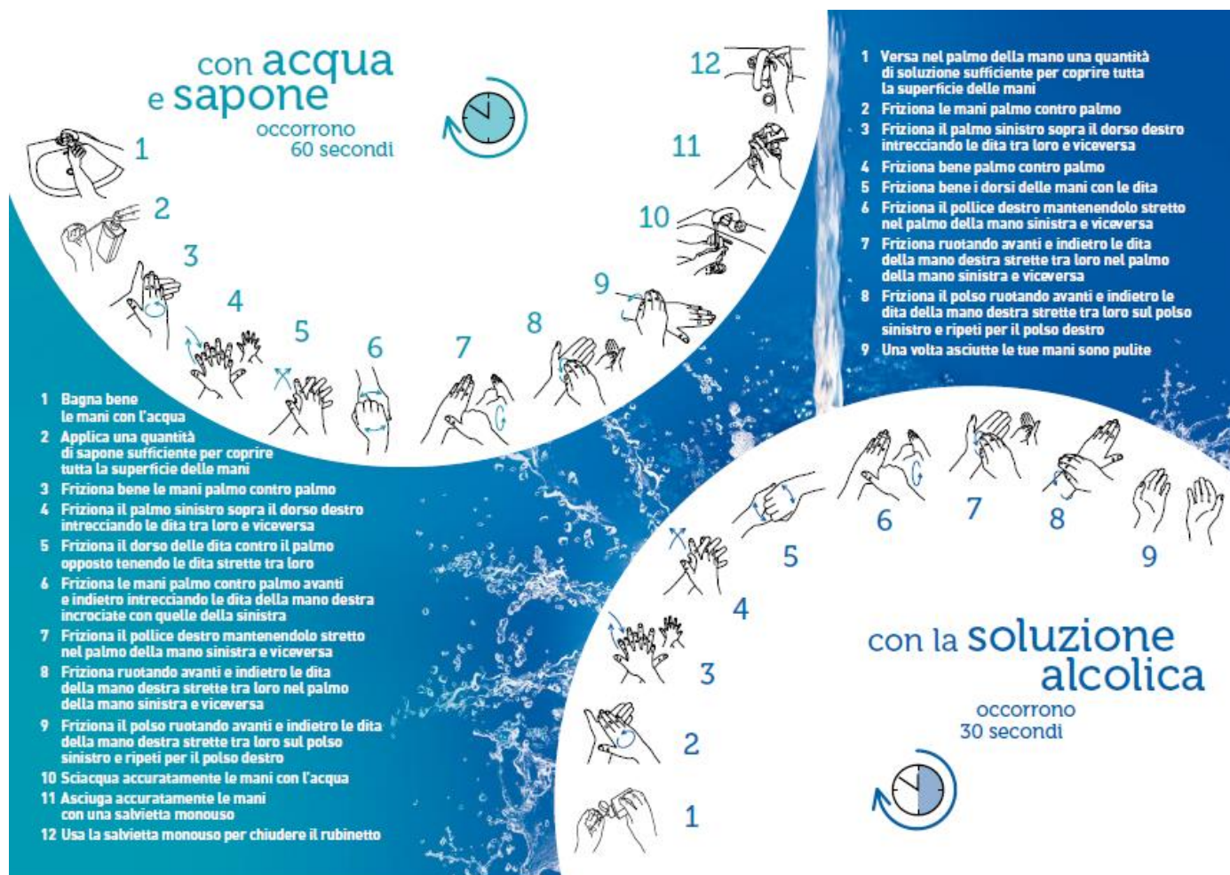
Riferimento 1 – ALLEGATO 4

Per le tecniche di dettaglio “ Lavaggio delle mani ” si rimanda alle infografiche “ Riferimento 1 e 2 dell'ALLEGATO 4 ”. Di seguito si riportano le rappresentazioni infografica in formato ridotto: